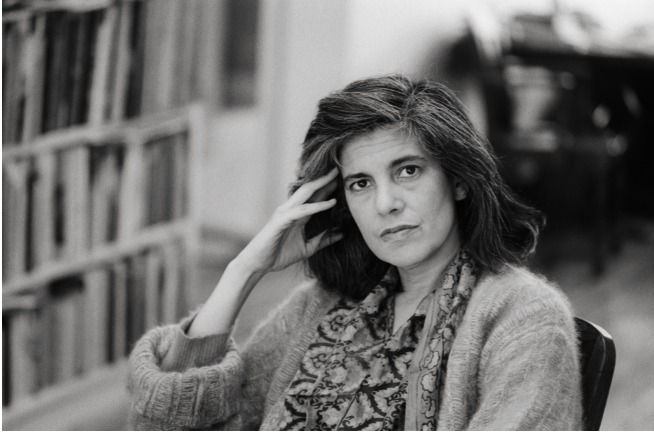
Figure 2: Author Susan Sontag

hacer, y quizá se ofrezcan a hacer, con entusiasmo, convencidos de que están en lo justo. No lo olvides.”